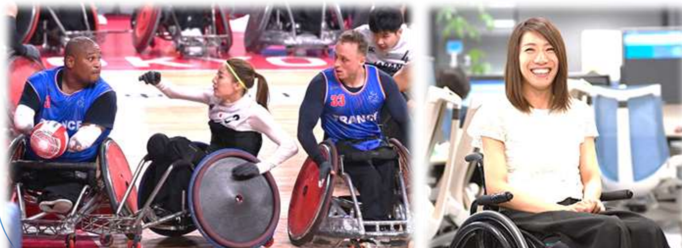
「毎日新聞令和3年8月26日付」より