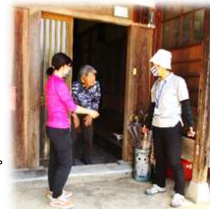
お弁当をお届けの様子

問合せ先 (NPO 法人わいわいみ・な・み) 48-0008 (城崎・竹野包括支援センター) 47-1425